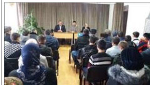
29.11.2018 Лекция в школе с.Даттах Лекция в школе с. Даттах на тему: "Методы наблюдения за