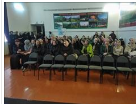
30.11.2018 Лекция в с.Урус-Мартан, школа №6 Лекция в школе №6, с. Урус-Мартан на тему: "Методы наблюдения за психическим здоровьем детей, а также основы диагностики психических расстройств у детей"