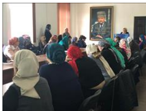
Межрегиональная конференция «Улучшение психического здоровья детей и подростков», первый день Презентация программ