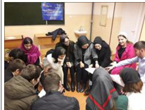
Работа второй экспериментальной группы Встреча участников экспериментальной группы, из числа родителей и детей. Работа в малых группах.