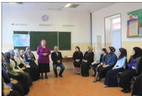
Работа второй экспериментальной группы Работа второй экспериментальной группы с подростками. Участники родители и дети.

Мероприятие: Организованы и работают две экспериментальные группы психотерапии из числа родителей и детей для коррекции психотравмирующей семейной среды проживания подростков с учетом этнических особенностей и исламских традиций