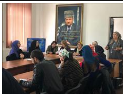
Межрегиональная конференция «Улучшение психического здоровья детей и подростков», первый день Выступление психолога АНО "Женщины за развитие"