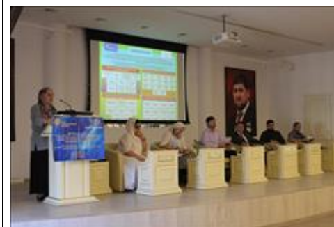
Презентация и распространение полиграфических материалов Данные материалы презентованы и распространены в рамках проекта по реестру раздачи

Количество публикаций за весь срок осуществления проекта