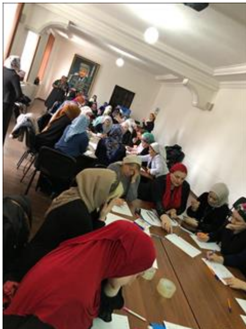
Межрегиональная конференция «Улучшение психического здоровья детей и подростков», второй день Курс повышения квалификации для педагогов и психологов сельских школ.