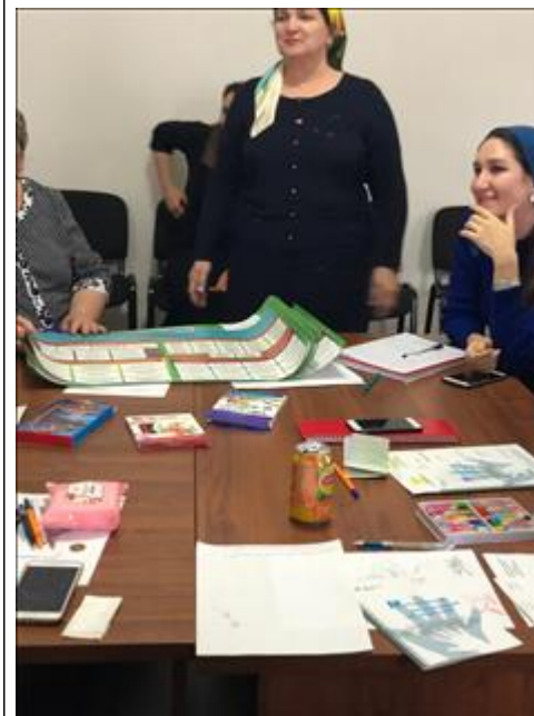
Презентация и распространение полиграфических материалов Данные материалы презентованы и распространены в рамках проекта по реестру раздачи