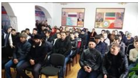
29.11.2018 Лекция в школе с.Даттах Лекция в школе с. Даттах на тему: "Методы наблюдения за