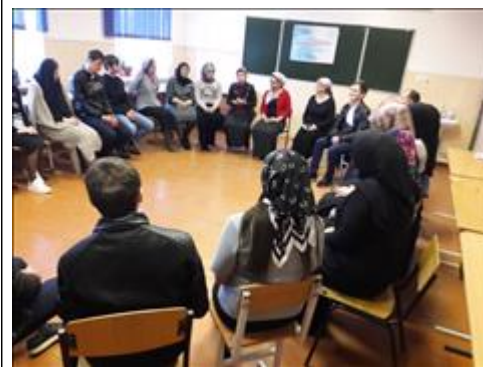
Работа второй экспериментальной группы Работа второй экспериментальной группы с подростками. Участники родители и дети.