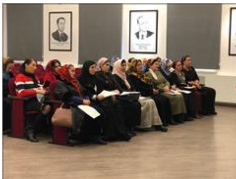
Заключительное заседание рабочей группы Участники заседания