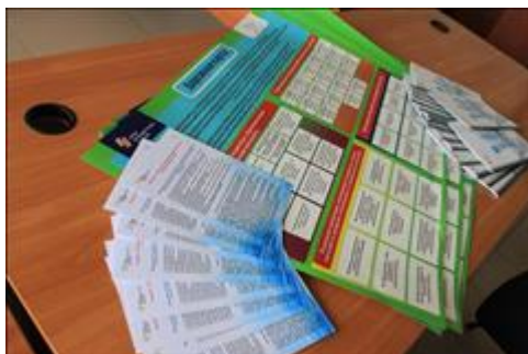
Полиграфические материалы Данные материалы были распространены в рамках проекта по реестру раздачи