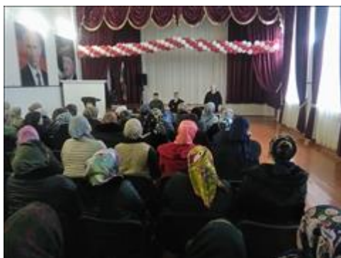
30.11.2018 Лекция в с.Урус-Мартан, школе №6 Лекция в школе №6, с. Урус-Мартан на тему: "Методы наблюдения за психическим здоровьем детей, а также основы диагностики психических расстройств у детей"