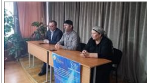
29.11.2018 Лекция в школе с. Даттах Лекция в школе с. Даттах на тему: "Методы наблюдения за психическим здоровьем детей, а также основы диагностики психических расстройств у детей"