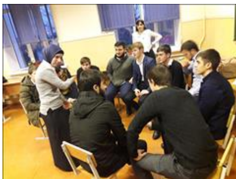
Работа второй экспериментальной группы Встреча участников экспериментальной группы, из числа родителей и детей. Работа в малых группах.