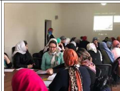
Межрегиональная конференция «Улучшение психического здоровья детей и подростков», второй день Курс повышения квалификации для педагогов и психологов