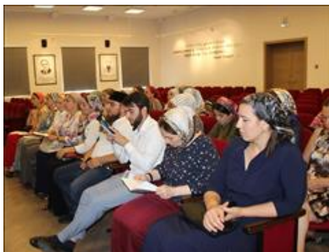
Презентация и распространение полиграфических материалов Данные материалы презентованы и распространены в рамках проекта по реестру раздачи