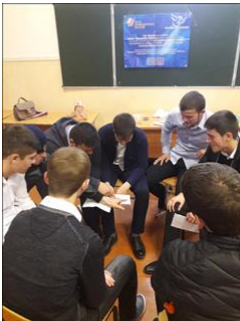
Работа второй экспериментальной группы Встреча участников экспериментальной группы, из числа родителей и детей. Работа в малых группах.