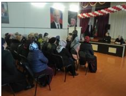
30.11.2018 Лекция в с. Урус-Мартан, школа №6 Лекция в школе №6, с. Урус-Мартан на тему: "Методы наблюдения за психическим здоровьем детей, а также основы диагностики психических расстройств у детей"