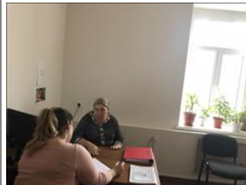
Прием психолога Фотография одной из консультаций психолога проекта.

Мероприятие: Организованы и работают две экспериментальные группы психотерапии из числа родителей и детей для коррекции психотравмирующей семейной среды проживания подростков с учетом этнических особенностей и исламских традиций