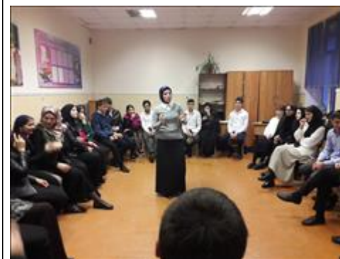
Работа второй экспериментальной группы Работа второй экспериментальной группы с подростками. Участники родители и дети

Мероприятие: Распространение 1 000 экземпляров Рекомендаций для родителей подростков, направленные на улучшение детско-родительских отношений и коррекцию психотравмирующей семейной среды проживания подростков с учетом этнических особенностей и исламских традиций, а также 2 500 памяток с актуальными номерами и адресами оказания психологической помощи на региональном и федеральном уровне.