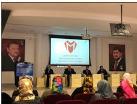
Заключительное заседание рабочей группы Спикеры