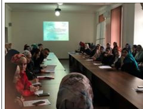
Межрегиональная конференция «Улучшение психического здоровья детей и подростков», первый день Фото участников